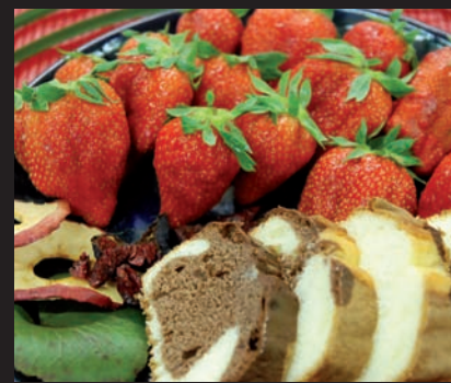
Apéro, Vorspeise, Hauptspeise aus der eigenen Schale